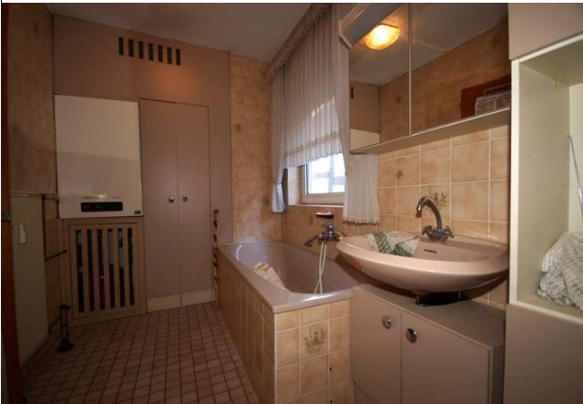
Bad 1. Stock