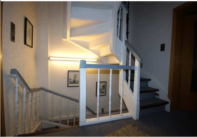
Flur 1. Stock