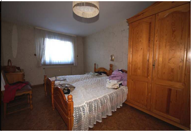
Schlafen 1. Stock