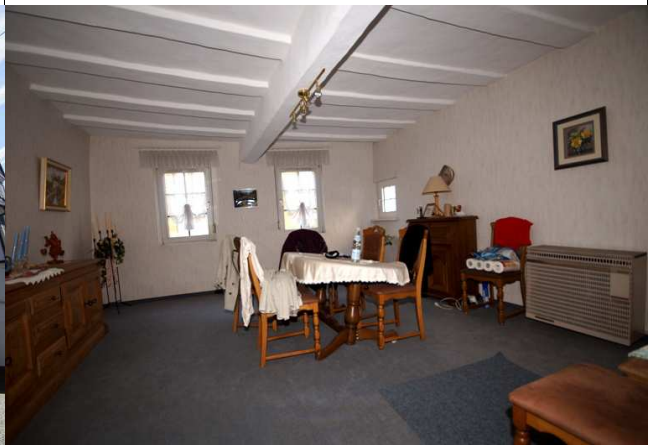
Wohnen 1. Stock