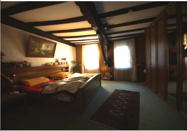
Schlafen 2. Stock