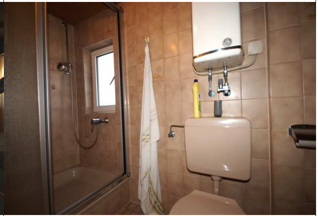
Bad 2. Stock