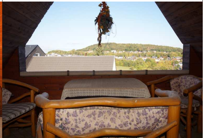
Loggia mit Fernblick