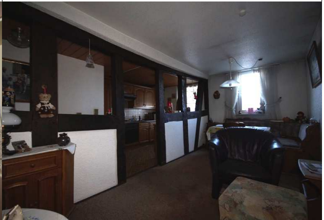
Wohnen und Kochen 2. Stock