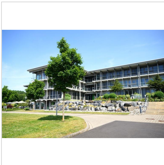
Ansicht des Gebäudes