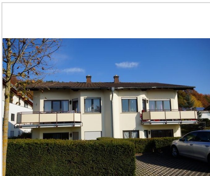
Ansicht des Hauses

Lassen Sie sich bei einer Besichtigung von dieser tollen Wohnung überzeugen. Ein Termin ist nach kurzer Rücksprache mit unserem Büro möglich.